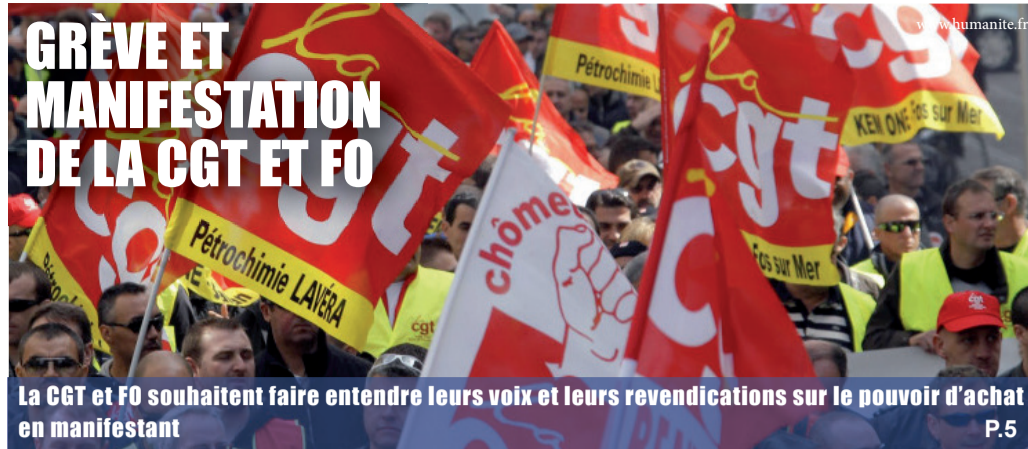
La CGT et FO souhaitent faire entendre leurs voix et leurs revendications sur le pouvoir d'achat en manifestant P.5