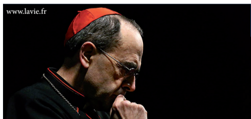
L'avenir de l'archevêque de Lyon est entre les mains du Pape François. P.6