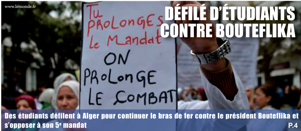
Des étudiants défilent à Alger pour continuer le bras de fer contre le président Bouteflika et s'opposer à son 5 e mandat P.4