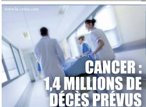
CANCER : 1,4 MILLIONS DE DÉGÈS PRÉVUS D'après des estimations de chercheurs, le cancer devrait toucher plus de 1,4 millions d'euro-péens en 2019. P.7