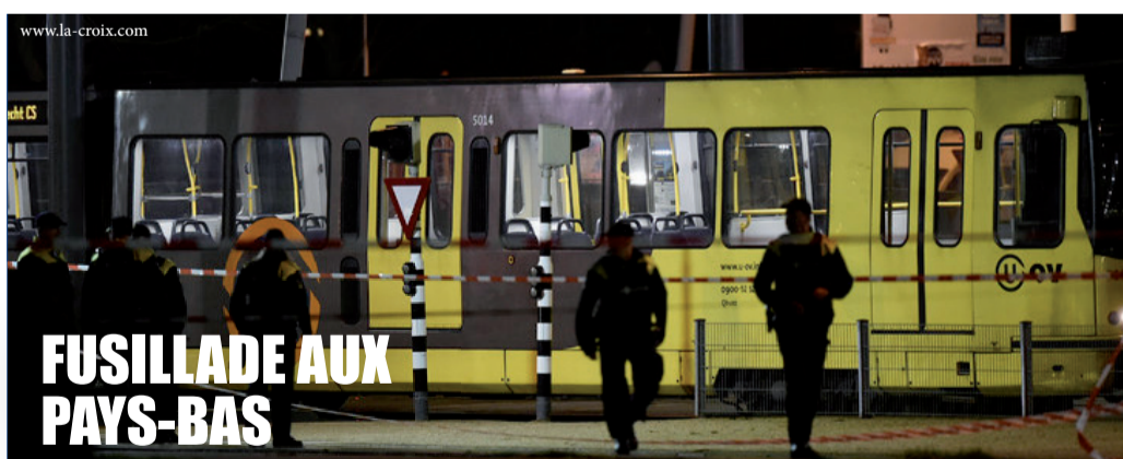
FUSILLADE AUX PAYS-BAS