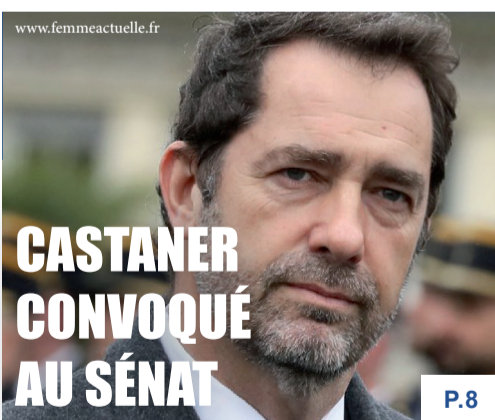
CASTANER CONVOQUÉ AU SÉNAT P.8